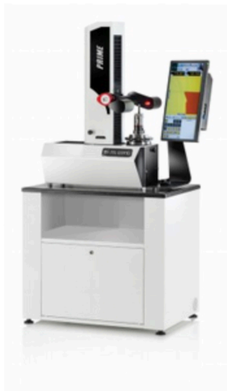
Presetter M.Conti completo, robusto e semplice da usare. La verifica della geometria utensile è facile e intuitiva.

L'innovazione di eseguire il test con aria presuppone la realizzazione di un algoritmo che gestisce l'interfaccia di correlazione area/olio, per fare in modo che i risultati ottenuti siano riconducibili a un funzionamento idraulico. La collaborazione ha permesso di superare sfide complesse, come la definizione di tale moltiplicatore di pressione aria/olio e la fornitura di componenti adatti a lavorare in condizioni di alta pressione. Il cuore del sistema è rappresentato dal software sviluppato per