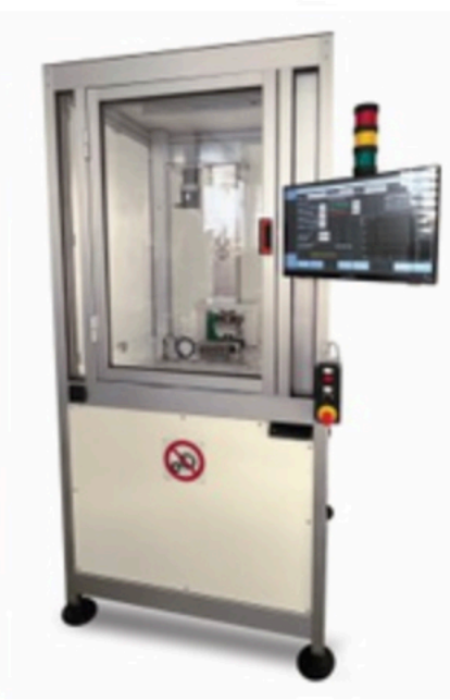
Gruppo Mondial ha fornito i cilindri EcoElectric di GTS per il banco di controllo qualità di valvole idrauliche ad alta pressione, sviluppato da Sia.

Il Gruppo Mondial è ai vertici nel settore delle trasmissioni di potenza. Non solo attraverso la rappresentanza delle più importanti società internazionali, ma anche attraverso la progettazione di un'ampia gamma di prodotti speciali, in grado di rispondere alle più svariate esigenze di molti settori industriali. Una competenza che si è approfondita attraverso l'allargamento del Gruppo a realtà specializzate in soluzioni meccatroniche che integrano la meccanica con l'ingegneria informatica ed elettronica per sostenere l'automazione produttiva. Recentemente il Gruppo Mondial ha collaborato con due utilizzatori nell'elaborazione di soluzioni altamente innovative dedicate all'automotive. Vediamo di che cosa si tratta.